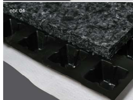
obr. 01 | GREENDEK 20 obr. 02 | GREENDEK 20 PLUS obr. 03 | GREENDEK 40 obr. 04 | GREENDEK 40 PLUS