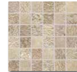
DDM05693 (SET) PEI 5 \odot 72 | set mat | matt běžová | beige