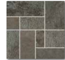
DDP34694 PEI 3 \odot 72 | set mat | matt