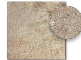
DAR34693 PEI 5 \odot 72 | m 2 mat | matt