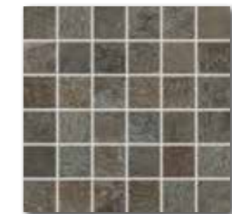
DDM05694 (SET) PEI 3 \odot 72 | set mat | matt hnědočerná | brown-black