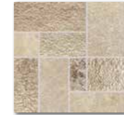
DDP34693 PEI 5 \odot 72 | set mat | matt