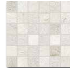
DDM05692 (SET) PEI 5 \odot 72 | set mat | matt bílá | white