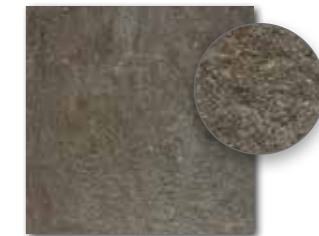
DAR34694 PEI 3 \odot 72 | m 2 mat | matt