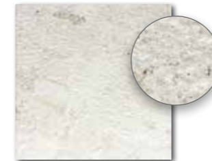
DAR34692 PEI 5 \odot 72 | m 2 mat | matt

Before laying the tiles, we suggest you select from several cartons and arrange them as illustrated in the inspiration photo documentation in RAKO catalogues or website www.rako.eu , and mix the tiles to achieve the required result including turning them by 90° or 180°.