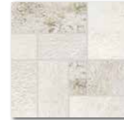
DDP34692 PEI 5 \odot 72 | set mat | matt