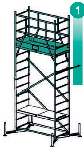
1. Patro Základní lešení