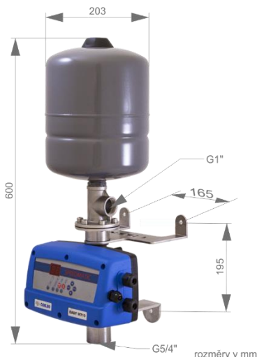
ANA4 Fxx - úchyty