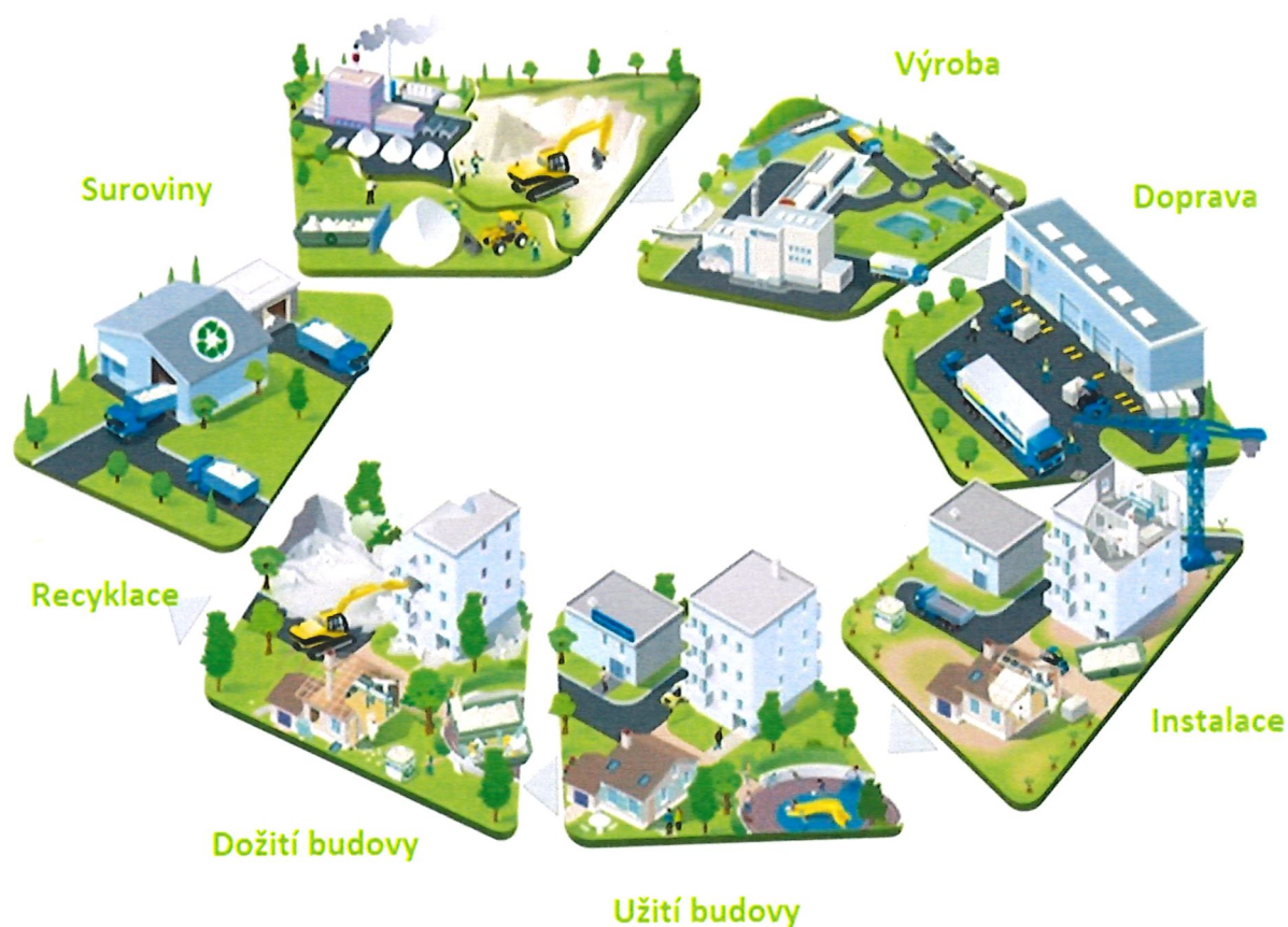
Diagram životního cyklu