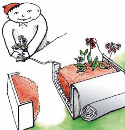
Při budování rostlinných koryt a zahradních květináčů zajistí FILTEK HOME oddělení šterkopísku a zeminy a zabraňuje jejich postupnému promísení a znečištění