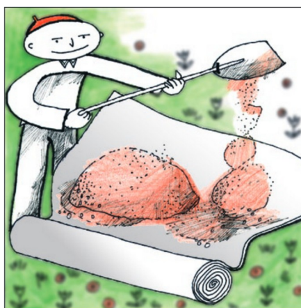
FILTEK HOME chrání trávu, povrchy a jiné citlivé plochy před znečištěním.