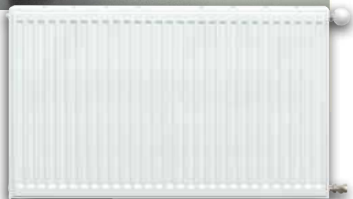
Radiátory klasického vzhledu s bočním připojením.