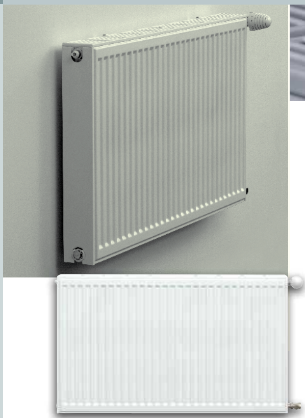
Radiátory klasického vzhledu s bočním připojením.