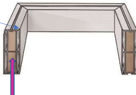
Detail B, sešroubování