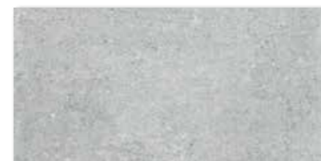
DAKSE661 PEI 5 ○ 78 | m 2 mat | matt