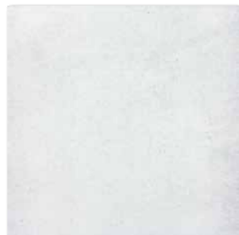
DAK63660 PEI 5 ○ 82 | m 2 mat | matt