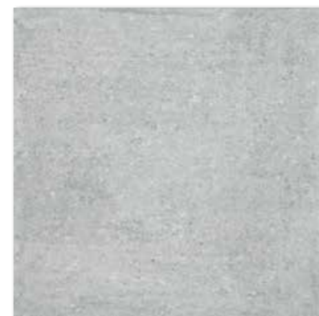
DAK63661 PEI 5 ○ 82 | m 2 mat | matt