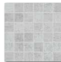
DDM0661 [SET] PEI 5 \bigcirc 72 | set mat | matt šedá | grey