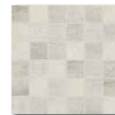
DDM0662 [SET] PEI 5 \bigcirc 72 | set mat | matt šedoběžová | grey-beige