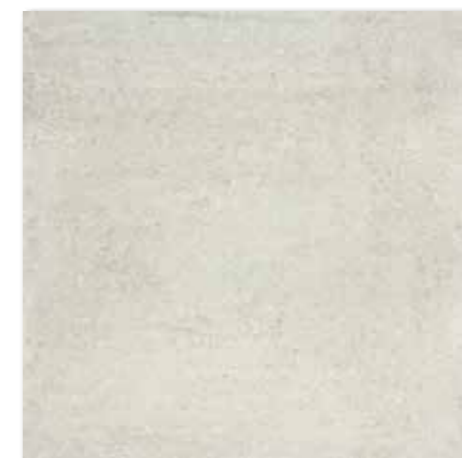
DAK63662 PEI 5 ○ 82 | m 2 mat | matt