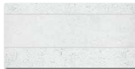
DDPSE660 PEI 5 \bigcirc 68 | ks mat | matt