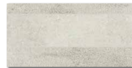
DDPSE662 PEI 5 \bigcirc 68 | ks mat | matt