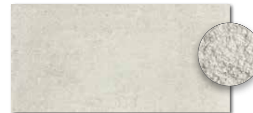
DARSE662 PEI 5 ○ 82 | m 2 mat | matt | R10 | B šedobéžová | grey-beige