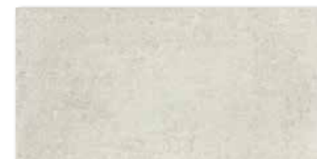
DAKSE662 PEI 5 ○ 78 | m 2 mat | matt