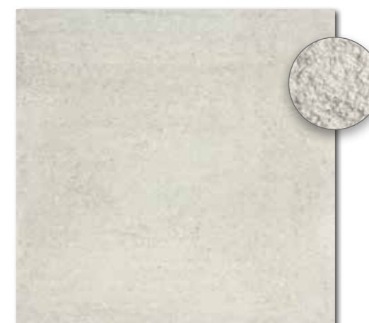
DAR63662 PEI 5 ○ 86 | m 2 mat | matt