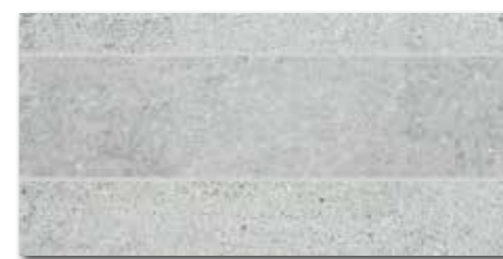
DDPSE661 PEI 5 \bigcirc 68 | ks mat | matt