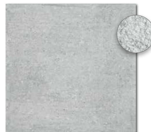
DAR63661 PEI 5 ○ 86 | m 2 mat | matt