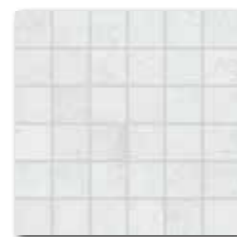
DDM0660 [SET] PEI 5 \bigcirc 72 | set mat | matt světle šedá | light grey