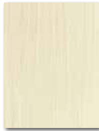
WARKB016 ○ 62 | m 2 mat | matt