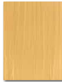
WARKB017 ○ 62 | m 2 mat | matt