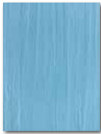
WARKB019 ○ 62 | m 2 mat | matt