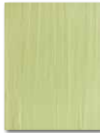
WARKB018 ○ 62 | m 2 mat | matt