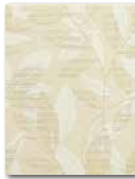
WITKB091 ○ 56 | ks mat | matt