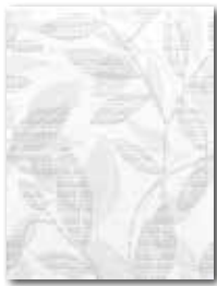
WITKB090 ○ 56 | ks mat | matt