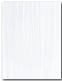
WARKB015 ○ 62 | m 2 mat | matt