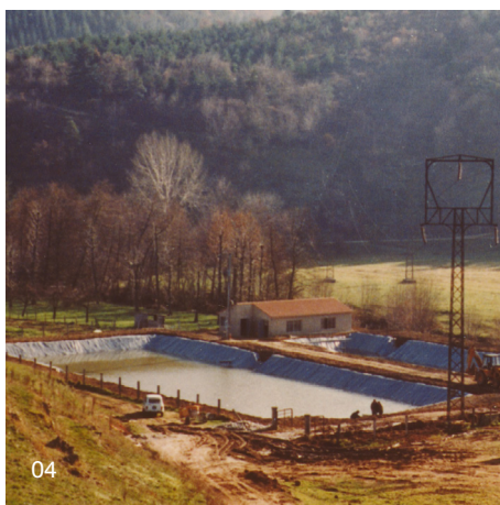
04 | Vodní nádrž, Itálie

Veškeré informace včetně kompletního technického poradenství poskytnou vyškolení pracovníci Ateliéru DEK v prodejnách Stavebniny DEK.