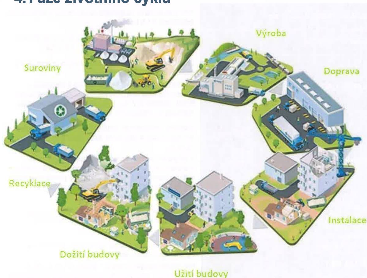
Diagram životního cyklu