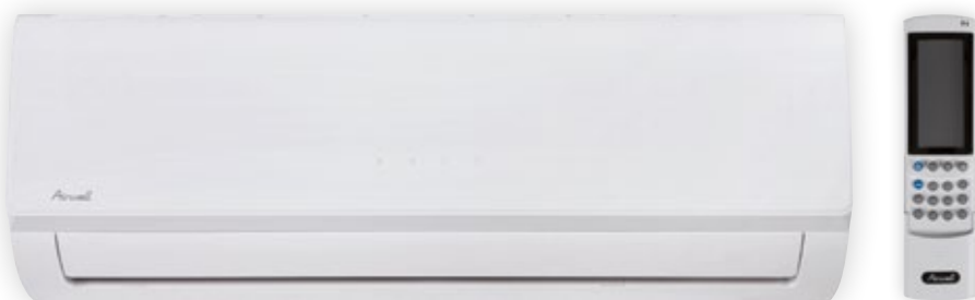
RC08C součástí balení